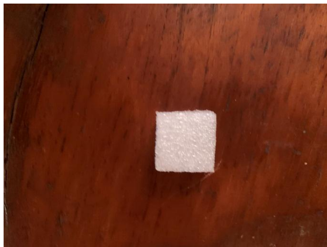
โฟมตัดตามขนาดของกระดาด