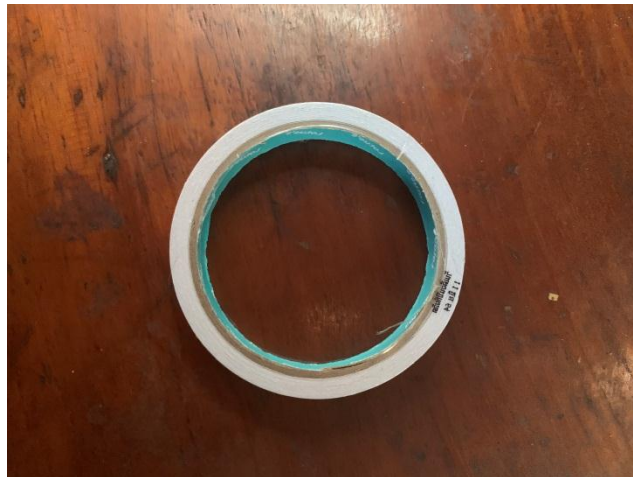
กาวสองหน้าอย่างบาง