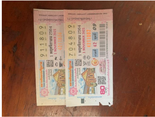
ใบหวยรัฐบาลที่ไม่ใช้แล้ว