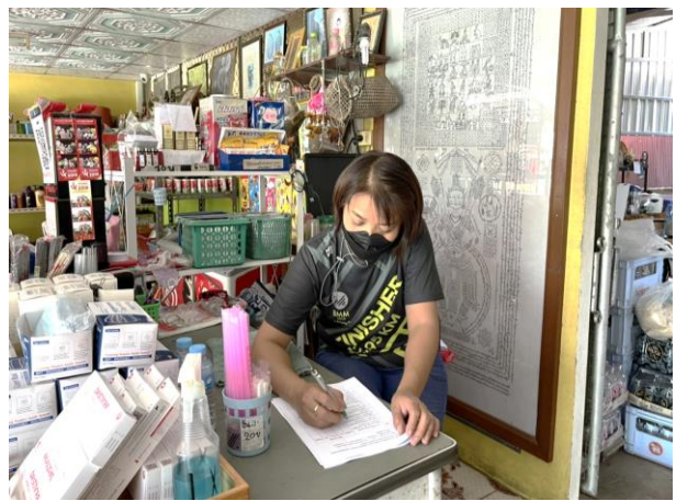
การเก็บข้อมูลวิจัยในพื้นที่เทศบาลตำบลป่าเมต อำเภอเมืองแพร่ จังหวัดแพร่