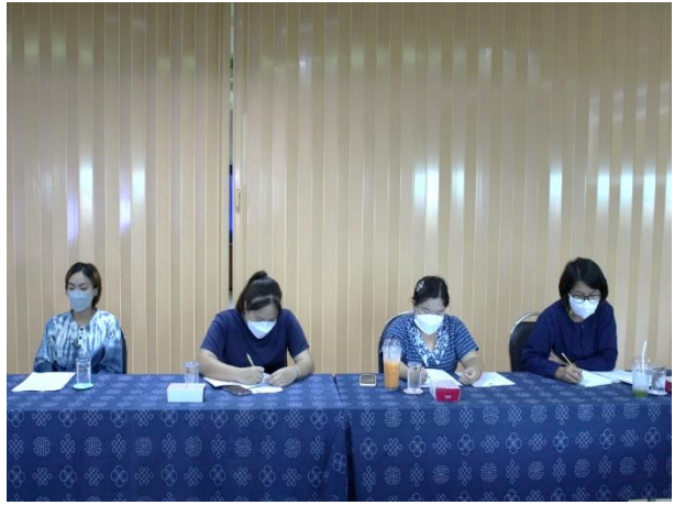
การเก็บข้อมูลวิจัยในพื้นที่เทศบาลตำบลป่าเมต อำเภอเมืองแพร่ จังหวัดแพร่