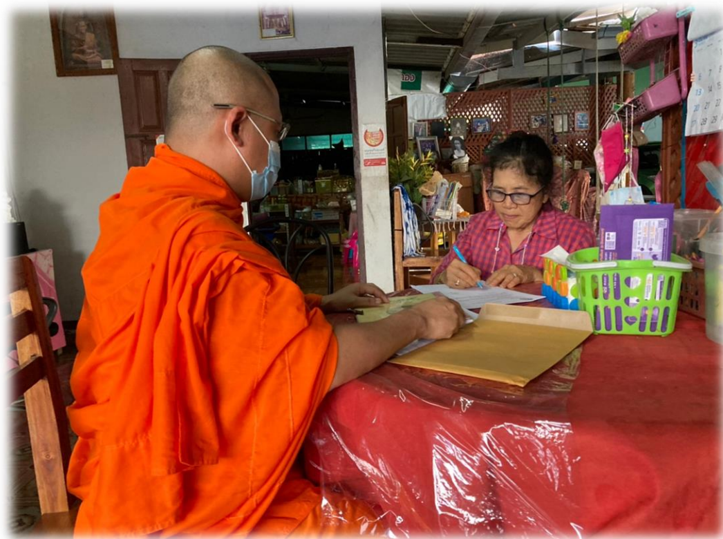
สัมภาษณ์กลุ่มเป้าหมายในพื้นที่