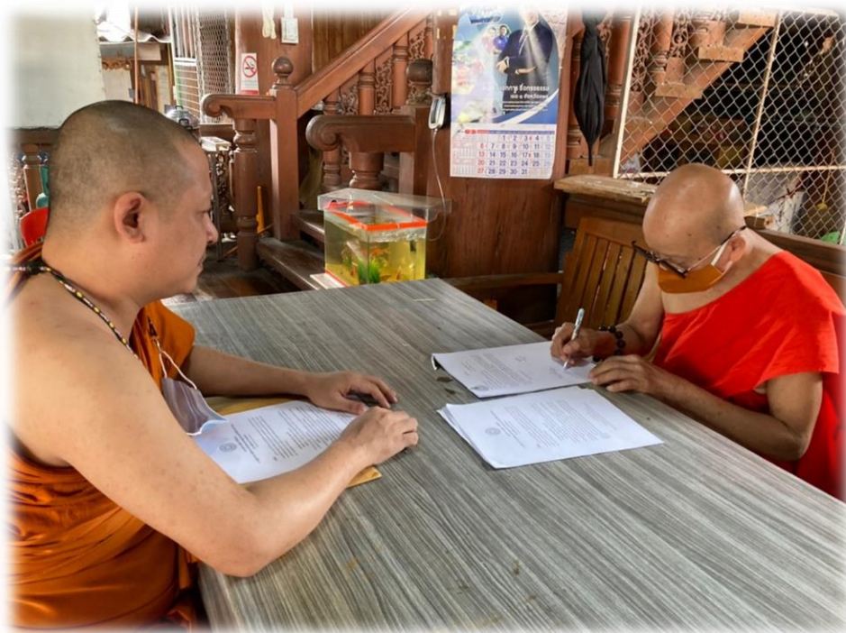
สัมภาษณ์กลุ่มเป้าหมายในพื้นที่