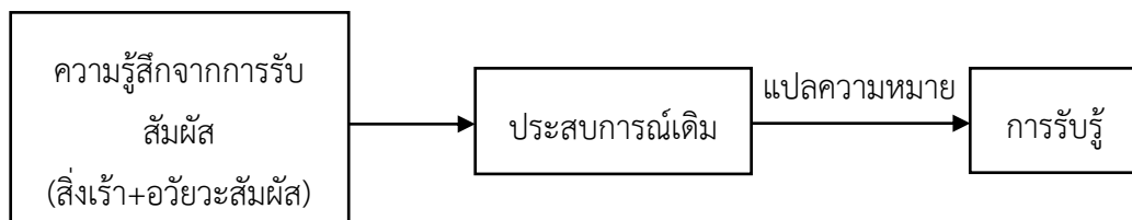
แผนภาพที่ ๒.๒ แสดงกระบวนการรับรู้ตามแนวตะวันตก

สรุปได้ว่า การเรียนรู้จะเกิดขึ้นได้ต้องอาศัยการรับรู้ การรับรู้จึงเป็นการเรียนรู้อย่างหนึ่ง และเป็นพื้นฐานที่สำคัญของกระบวนการเรียนรู้การรับรู้เป็นกระบวนการที่เกิดขึ้นระหว่างสิ่งเร้า และ