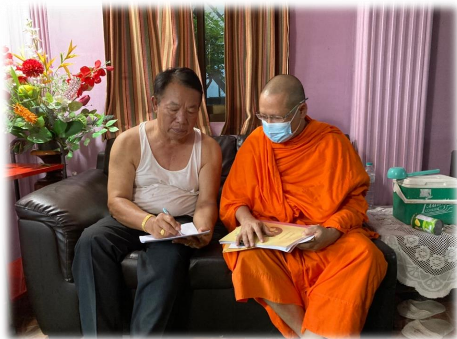
สัมภาษณ์นักเรียนผู้สูงอายุใน