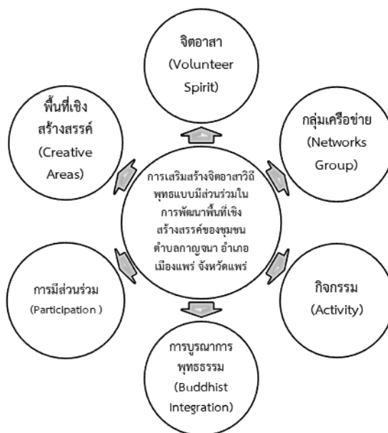
แผนภาพที่ ๔.๑ แสดงองค์ความรู้รูปแบบกระบวนการเสริมสร้างจิตอาสาวิถีพุทธแบบมีส่วนร่วมในการพัฒนาพื้นที่เชิงสร้างสรรค์ของชุมชนตำบลกาญจนา อำเภอเมืองแพร่ จังหวัดแพร่